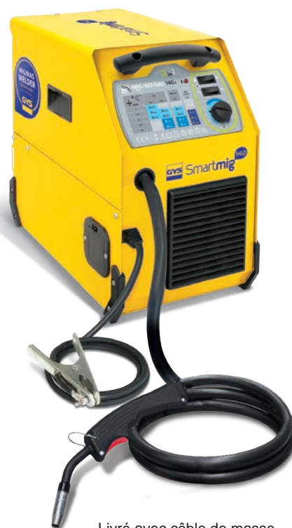
Livré avec câble de masse et torche fixe 2m.

Son ventilateur à débit constant le protège des surchauffes.