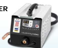
PROLINER 39.02 - ref. 035775 PROLINER 39.04 - ref. 035782