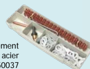
Boite complément débosselage acier ref. 050037