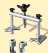
Alu Puller ref. 051003