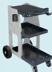
Chariot SPOT 800 ref. 051331