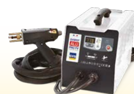
PROLINER ALU PRO FV - ref. 035836