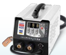
PROLINER PRO 230 - ref. 035799 PROLINER PRO 400 - ref. 035805