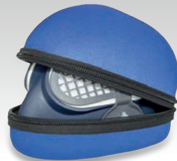
Étui de rangement 037045