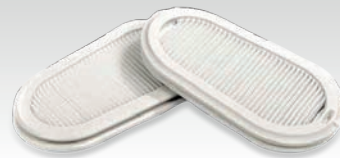
2 filtres de rechange FFP3 037038