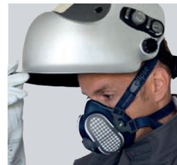
Efficacité Filtration Poussières (0,6 µm)