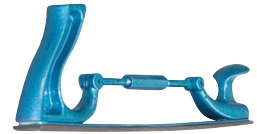
Rape pour carrossier 051423