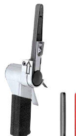
Ponceuse à bande 10 x 330 mm 052819

Retrouvez toutes les caractéristiques de la servante ici