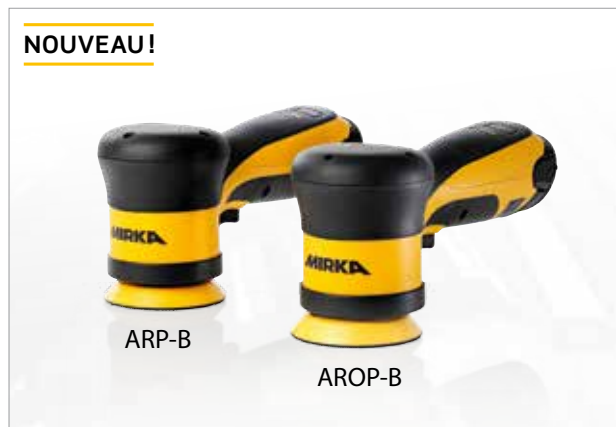
Polisseuses Mirka® ARP-B et AROP-B