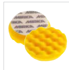
Mousse de polissage Mirka, jaune alvéolée