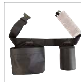
Ceinture porte-outils Mirka