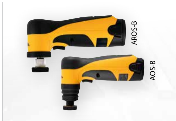
Ponceuses Mirka® AOS-B et AROS-B