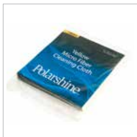
Chiffon de lustrage jaune