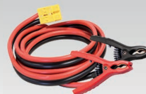
2 x 8 m - 16 mm 2 056572