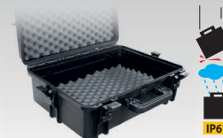
Valise de transport 060432