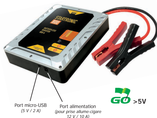
Port micro-USB (5 V / 2 A)