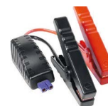
Câble de démarrage intelligent