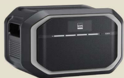
Power Batt 14 - Batterie externe 085213

Le Power Batt 14 est une batterie lithium externe dont la capacité de stockage de 1408 Wh permet de doubler l'autonomie du Power Pack 14.15 FC.